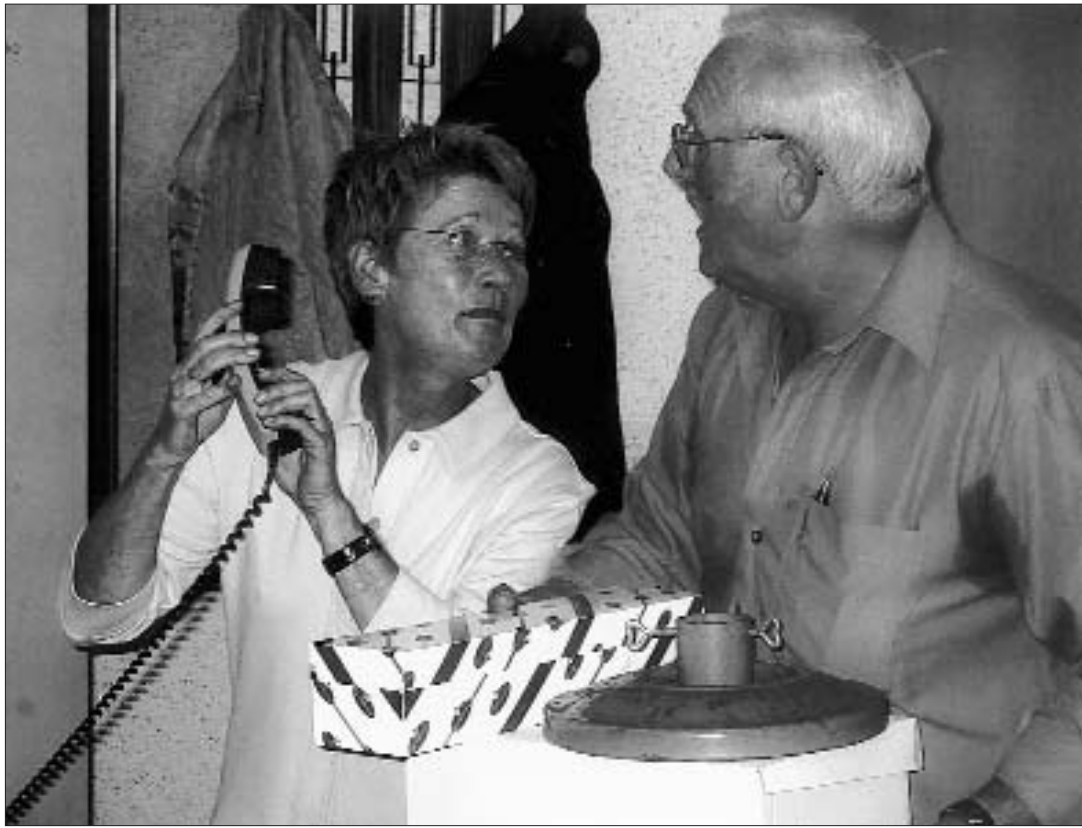
Liebhaberbühne: Obwohl die Theatersaison am 8. November startet, steht sie mit dem ersten Stück «Da hesch de ds Gschänk» ganz im Zeichen des Heiligen Abends.

Auch wenn die diesjährige Theatersaison der Liebhaberbühne am 8. November startet, steht sie doch ganz im Zeichen des Heiligen Abends. So ist denn auch der Titel des Stückes «Da hesch de ds Gschänk» absolut treffend. Zum einen gehören Geschenke nun mal zu Weihnachten wie der Tannenbaum und das Festessen. Zum andern aber verläuft der Heilige Abend der Familie Iseli in keiner Weise wie geplant und führt von einer Bescherung zur nächsten: Die Heizung ist ausgefallen und der Kühlschrank gibt ebenfalls zu ungünstigster Zeit seinen Geist auf. Dadurch wird die Weihnachtsgans ungeniessbar und raschmöglicht